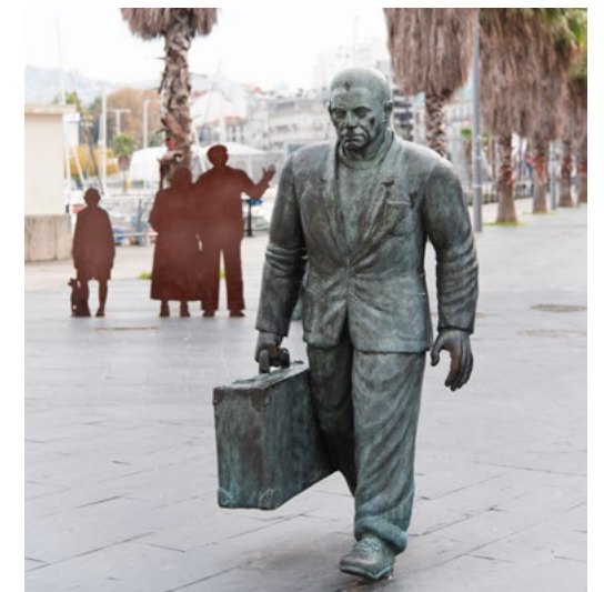
P. CI-CONTRE Le nageur EN BAS Monument à l'émigrant

Notre itinéraire débute dans la rúa de Cánovas del Castillo 1, face à la gare maritime, un lieu qui évoque la mémoire des milliers d'émigrants galiciens qui ont embarqué en direction de l'Amérique ; de ce passé, il ne nous reste que le témoignage muet de Ramón Conde, avec son MONUMENT À L'ÉMIGRANT , qui souhaite aujourd'hui la bienvenue aux nombreux croisiéristes qui font escale dans la ville chaque année pour la visiter. La Cafétéria-restaurant Albatros , située dans la gare maritime, juste au-dessus du quai où accostent les paquebots, per-