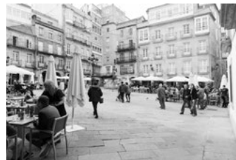
C Praza da Constitución