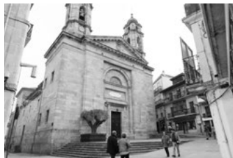
A Praza da Pedra et collégiale de Santa Maria