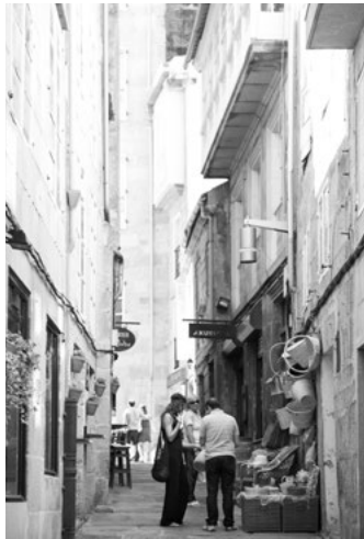
B Rúa dos Cesteiros