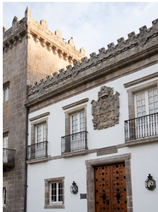
EN BAS Pazo Quiñones de León

za de España, empreinte d'un formidable dynamisme et véritable hommage à la fête ancestrale d' A RAPA DAS BESTAS , la PORTE DE L'ATLANTIQUE , de Silveiro Rivas, sur la plaza América, qui nous rappelle que Vigo est la porte vers l'Amérique, le MONUMENT AU FORGERON , de Guillermo Steinbrüggen, sur la place Eugenio Fadrique, qui témoigne de l'importance du secteur métallurgique dans l'industrie navale, ou L'ENLÈVEMENT D'EUROPE , de Juan Oliveira, sur l'avenue de Samil, qui nous mène à la plage la plus populaire de Galice, un lieu idéal pour profiter du grand air