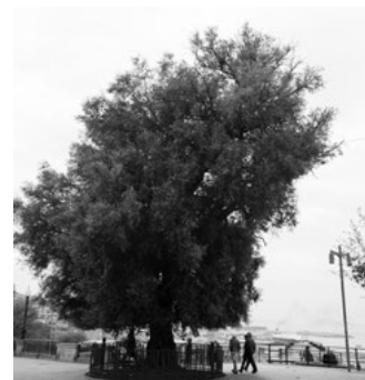
D Mirador del Olivo