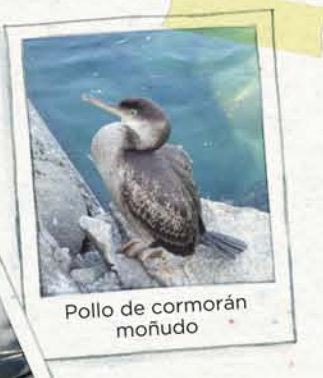
Pollo de cormorán moñudo

En estas islas están una de las mayores colonias de cría de estas dos aves marinas.