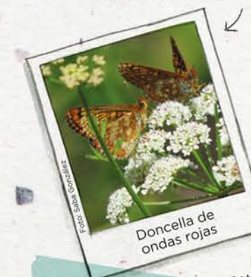
Doncella de ondas rojas

Euphydryas aurinia . Es una mariposa protegida en Europa pues está desapareciendo en muchos sitios.