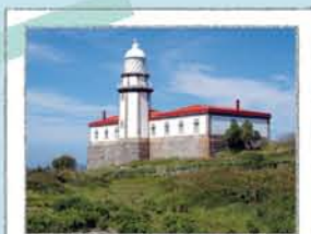
FARO DE ONS

Te ofrece una buena vista de la isla de Onza, las islas Cíes y la ría de Pontevedra. En el verano las crías de gaviota tienen en el acantilado su guardería, por lo que para no molestarlas no salgas del mirador ni las alimentos.