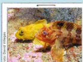
PLAYAS Y AGUAS

En las rocas próximas a las playas se ve gran variedad de vida marina. Descúbrala con unas gafas de buceo. Disfrútala sin tocarla. Para usar cinturón de plomos se necesita permiso.