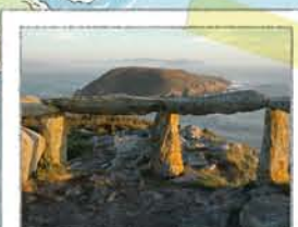
MIRADOR DE FEDORENTOS

Te ofrece una buena vista de la isla de Onza, las islas Cíes y la ría de Pontevedra. En el verano las crías de gaviota tienen en el acantilado su guardería, por lo que para no molestarlas no salgas del mirador ni las alimentos.