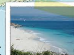
PLAYA DE MELIDE

De tradición nudista, donde puedes bañarte, ver la fauna marina y la flora dunar (sin pisar).