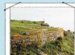
PUNTA DO CASTELO

Mirador bordeado con las ruinas de una fortificación defensiva del s.XIX.