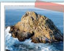
PUNTA DO CENTOLO