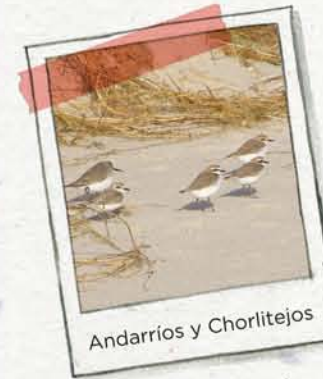
Andarriños y Chorlitejos

LAS PLAYAS se encuentran en la costa más tranquila, donde el mar deposita las arenas. Estas arenas son retenidas por las plantas de la duna, evitando así la erosión de la playa.