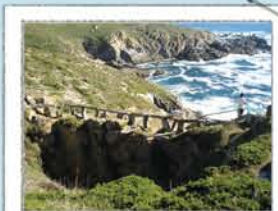
BURACO DO INFERNO

Grieta en el acantilado que mira de frente a los temporales marinos del sur, que la ensancharon y profundizaron hasta hundir su techo, creando una galería entre el cielo y el mar.