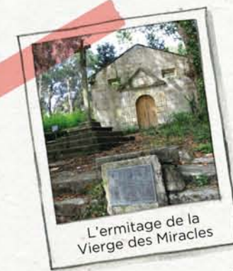
L'ermitage de la Vierge des Miracles

L'ermitage de la Vierge des Miracles fut construit à côté du village. De nombreux malades allaient en pèlerinage à cette chapelle pour y trouver un soutien.