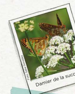
Damier de la succise

Euphydryas aurinia . Il est un papillon protégé en Europe.