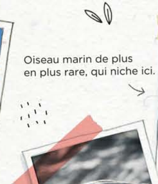
Oiseau marin de plus en plus rare, qui niche ici.