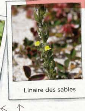
Linaire des sables

Parcourent le sable à la recherche de nourriture.