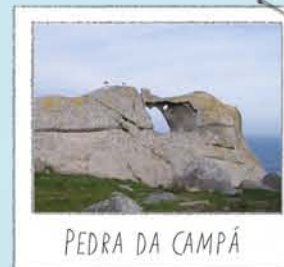
PEDRA DA CAMPÁ

Situé sur le point le plus haut de la visite. Endroit idéal pour contempler la falaise et le vol des goélands qui y nichent. Pour ne pas les déranger, veuillez à ne pas vous approcher des oiseaux et à ne pas les nourrir.