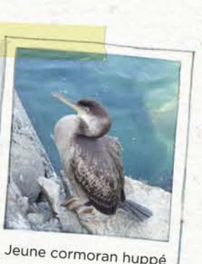
Jeune cormoran huppé