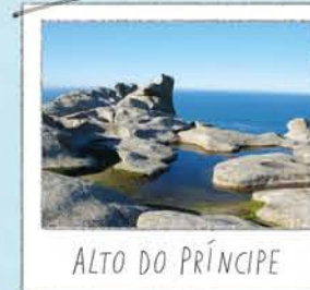
ALTO DO PRÍNCIPE

Une roche percée par le vent et le sel. L'observatoire tout proche offre de belles vues sur le lac et les falaises.