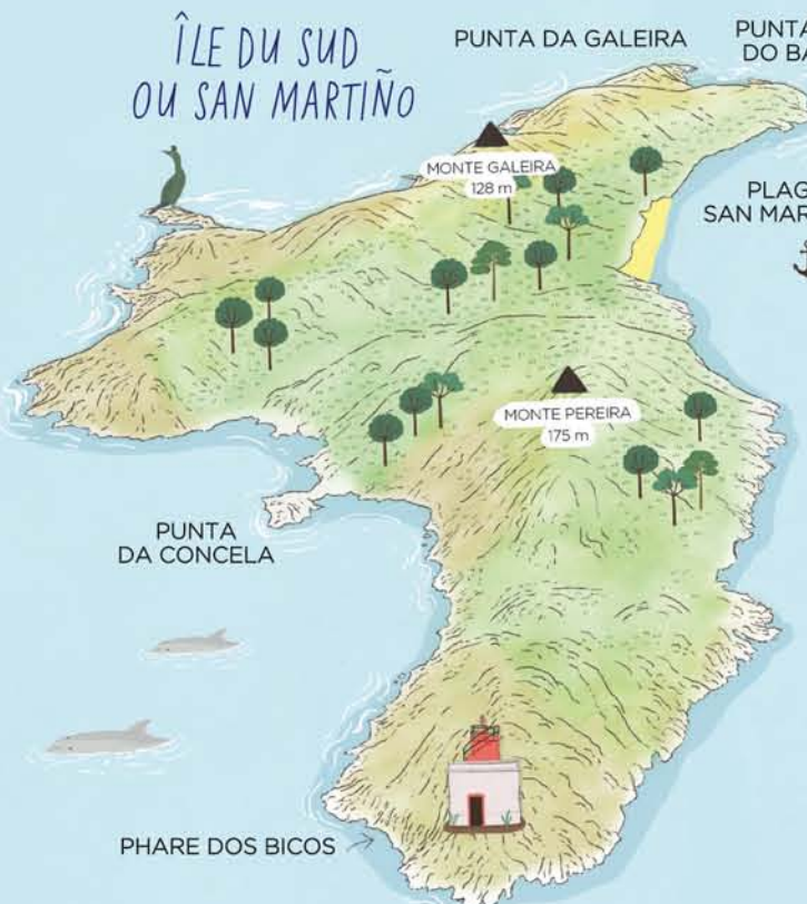
ÎLE DU SUD OU SAN MARTIÑO