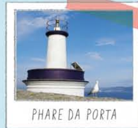
PHARE DA PORTA

Face à l'île Sur dont il nous offre l'une des meilleures vues panoramiques.