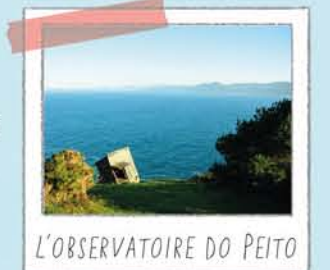
L'OBSERVATOIRE DO PEITO

Est une nappe d'eau dormante dans l'océan, un refuge pour la vie marine. En vous promenant sur la digue, vous apercevrez différentes espèces de poissons. Pour ne pas perturber leurs habitudes, veuillez à ne pas les nourrir et à ne pas vous baigner dans le lac.