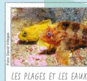
LES PLAGES ET LES EAUX