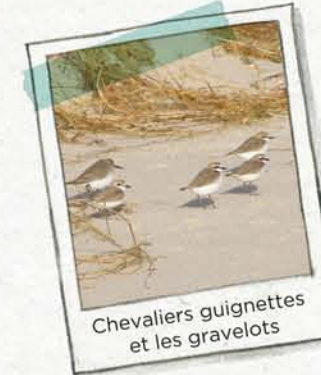
Chevaliers guignettes et les gravelots

LES PLAGES s'étendent sur la côte la plus calme, où la mer dépose les grains de sable. Ce sable est retenu par les plantes de la dune, ce qui empêche l'érosion de la plage.