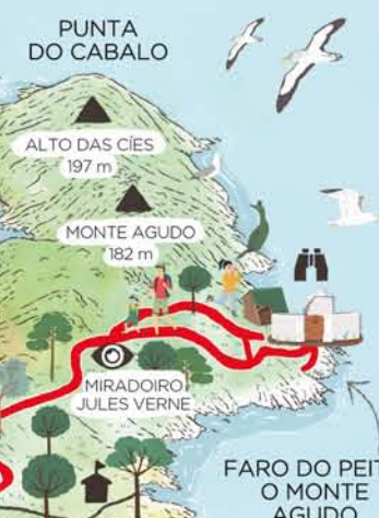
PUNTA DO CABALO

Un balcón de roca donde contemplar el lago y los acantilados. En el verano las crías de gaviota tienen aquí su guardería por lo que para no molestarlas, no entres en la zona de reserva indicada ni las alimentos.