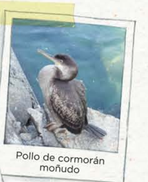
Pollo de cormorán moñudo

En estas islas están una de las mayores colonias de cría de estas dos aves marinas.