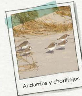
Andarrios y chorlitejos

LAS PLAYAS se encuentran en la costa más tranquila, donde el mar deposita las arenas. Estas arenas son retenidas por las plantas de la duna, evitando así la erosión de la playa.