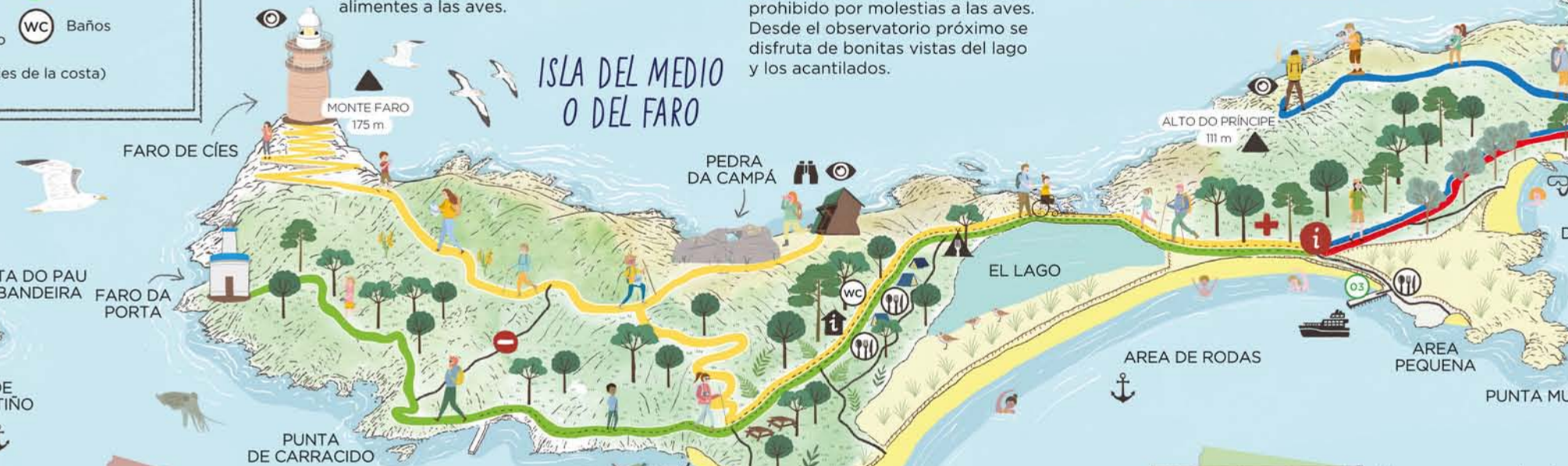
MONTE FARO 175 m