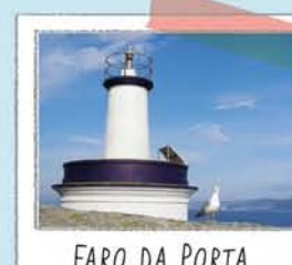
FARO DA PORTA

Enfrentado a la isla Sur, de la que nos regala una de sus mejores panorámicas.