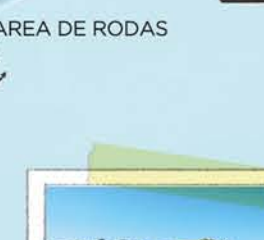
AREA DE RODAS