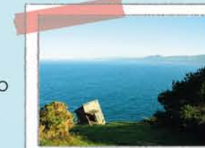
OBSERVATORIO DE O PEITO

El faro y el observatorio de O Peito tienen una bonita panorámica de las rías. Un buen lugar para observar las aves marinas que crían en los acantilados: gaviota patiamarilla y cormorán moñudo.