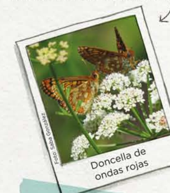
Doncella de ondas rojas

Euphydryas aurinia . Es una mariposa protegida en Europa pues está desapareciendo en muchos sitios.