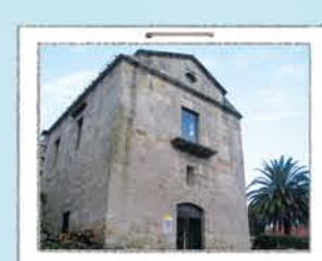
CENTRO DE VISITANTES

Enfrentado a la isla Sur, de la que nos regala una de sus mejores panorámicas.