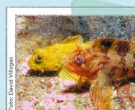
PLAYAS Y AGUAS