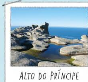
ALTO DO PRÍNCIPE

Una roca horadada por el viento y la sal del ambiente. Subirse está prohibido por molestias a las aves. Desde el observatorio próximo se disfruta de bonitas vistas del lago y los acantilados.