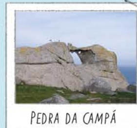
PEDRA DA CAMPÁ

Situado en el punto más alto visitable. Buen sitio donde contemplar el acantilado y el vuelo de las gaviotas que allí crían. Para no alterarlas no te acerques ni alimentos a las aves.