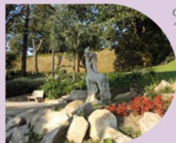
C. japonica 'Dona Jane Andresen'