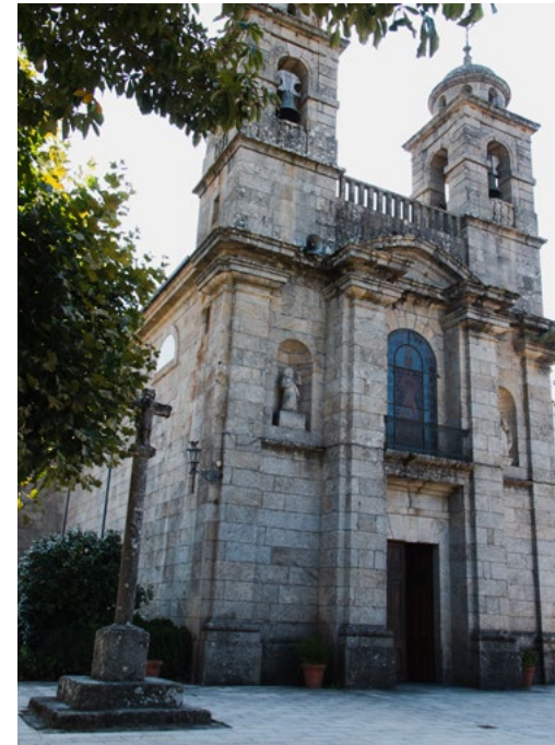
PAGE CI-CONTRE, EN HAUT Église de Santa Isabel PAGE CI-CONTRE, CI-DESSOUS Vue du cimetière EN HAUT Pensión rústica - restaurante Caldelas Sacra EN BAS Sanctuaire dos Remedios

tuaire dos Remedios 5. L'église actuelle a été construite en 1814 sur le site d'un ancien temple, qui avait subi d'importants dégâts lors de la guerre d'indépendance. Sa construction a été possible grâce aux dons en nature des habitants de la région, qui ont apporté bœufs, vaches, moutons, miel, céréales, fromage, vin... À l'intérieur, on observera les tirants qui contribuent à soutenir une partie de la structure, une solution ingénieuse attribuée au forgeron local Gervasio Mosquera, qui, à l'aide d'une longue clé et de la force d'une paire de bœufs, a serré les écrous visibles à l'extérieur. Le sanctuaire possède l'une des rares coupes elliptiques de Galice. De son parvis, le grand flambeau ( fachón ) est porté en procession la veille de la fête de San Sebastián le 19 janvier. Il s'agit d'une torche enflammée d'environ 30 mètres, élevée à l'aide de fourches par les hommes du village, qui suit l'image du saint à travers la ville. Cette célébration chrétienne de la Festa dos Fachós présente des traces ancestrales du culte du feu.