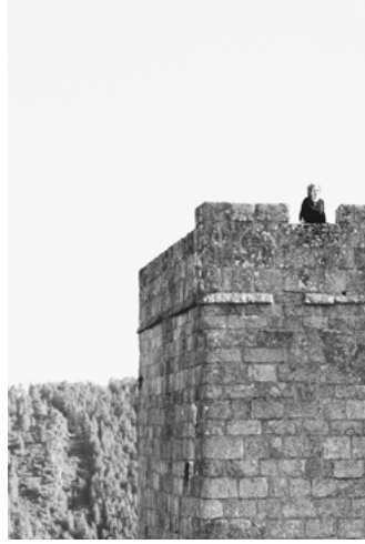
C Donjon et cour d'armes