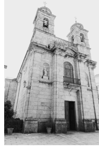
E Sanctuaire dos Remedios