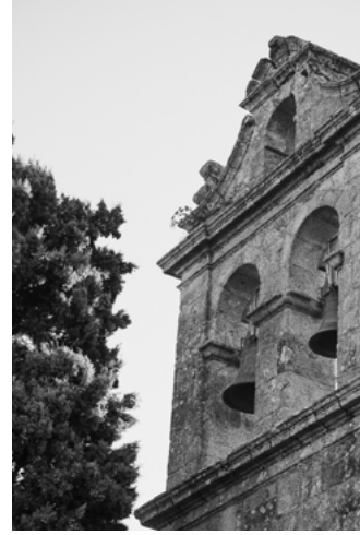
D Église de Santa Isabel