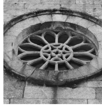
D Église de Santiago