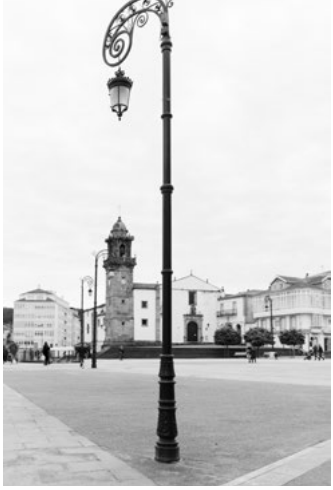
A Praza dos irmáns García Naveira