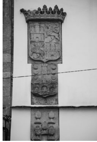
C Porta da Vila