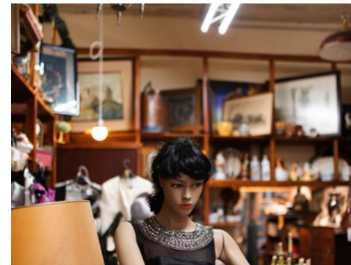
PAGE CI-CONTRE Rúa do Castro EN HAUT A Cabeza do Cabalo Branco EN BAS El rastro de Merce

Dans cette rúa do Castro, l'un des monuments dignes de mention est le CÁRCERE DO PARTIDO , dont le bâtiment abritait à l'origine le palais de Fernán Pérez de Andrade et a été reconstruit plus tard sous le règne de l'empereur Charles Ier. Au cours du XIXe siècle, certains des pre-