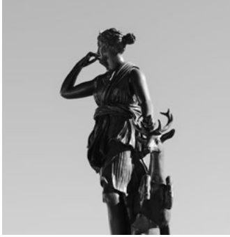
B Statue de Diane Chasseresse