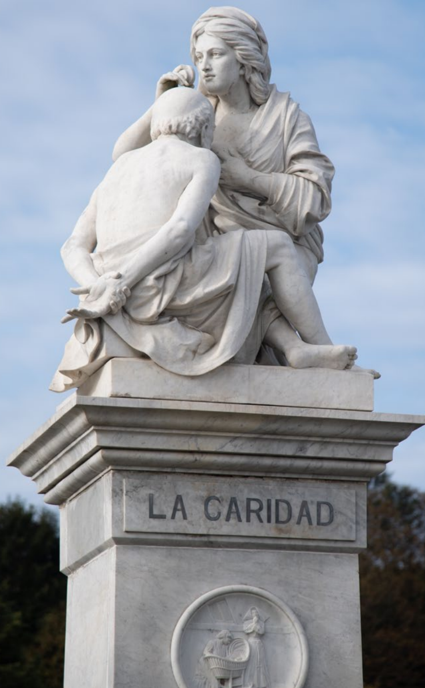
PPAGE CI-CONTRE Statue de La Caridad (de la Charité) EN BAS Parc do Pasatempo

Le LAVOIR continue d'accomplir la volonté des frères García Naveira, en étant public et gratuit, et la mairie est chargée de sa conservation et de sa surveillance. Il a été construit en 1902 pour les lavandières, la préférence étant donnée à celles qui vivaient de ce travail. Le bâtiment possède deux étages: au rez-de-chaussée, deux rangées de lavoirs utilisés en fonction des marées, et à l'étage supérieur, des