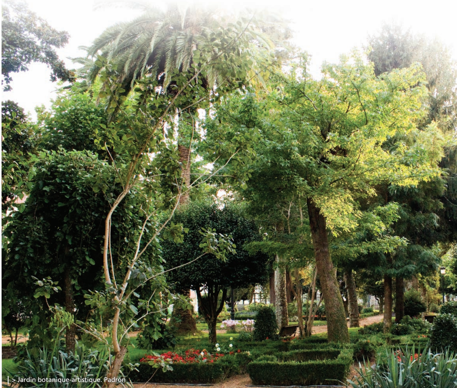
> Jardin botanique-artistique. Padrón