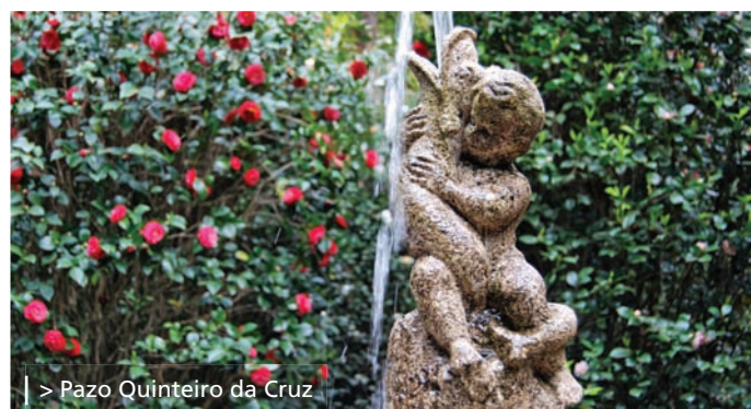
| > Pazo Quinteiro da Cruz

Les hôtes ne vous laisseront perdre aucun détail de l'ensemble d'élégants cryptomerias, de palmiers, des magnolias à feuilles sédentaires de l'entrée, des calocèdres, des énormes chênes-lièges et des camphriers, vous invitant à couper une feuille de ces derniers pour sentir l'odeur caractéristique du camphre. Vous serez sans doute étonné de la taille des gigantesques exemplaires d' Eucalyptus globulus plantés en 1820, parmi lesquels se trouve le plus grand d'Europe, avec 14 mètres de périmètre. Les surprises semblent ne pas finir à Rubiáns.