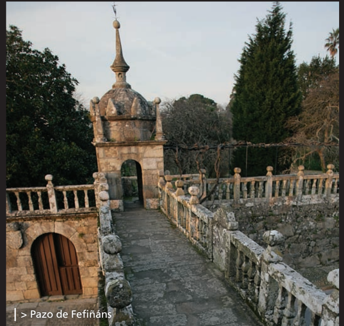
| > Pazo de Fefiñáns