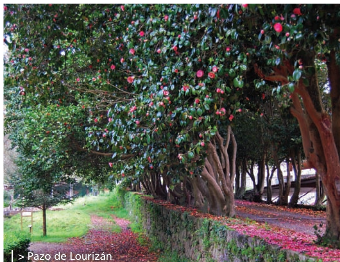
> Pazo de Lourizán