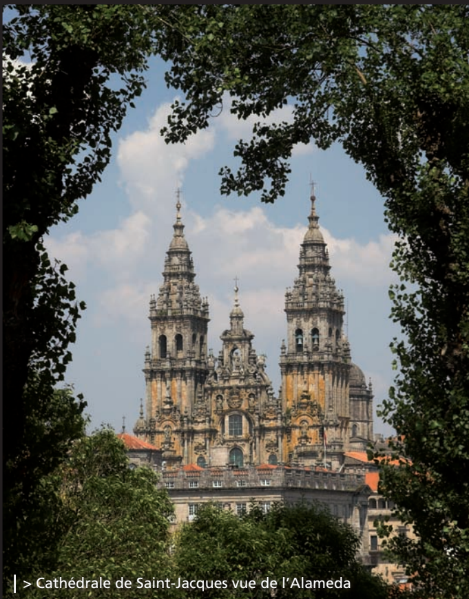
| > Cathédrale de Saint-Jacques vue de l'Alameda

Et au moment de prendre quelque chose ou de dîner, vous trouverez des établissements pour tous les goûts : restaurants, locaux spécialisés en fruits de mer, en 'tapas' ou en jambon, bistros et grills, bars ou tavernes. Ici, les gens ont pour habitude d'aller prendre des 'tapas' en se déplaçant d'un local à l'autre dans les rues pittoresques de Franco et A Raiña .