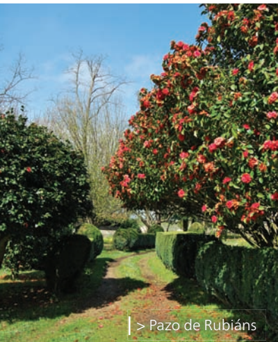
| > Pazo de Rubiáns