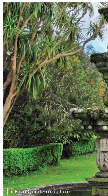
| > Pazo Quinteiro da Cruz