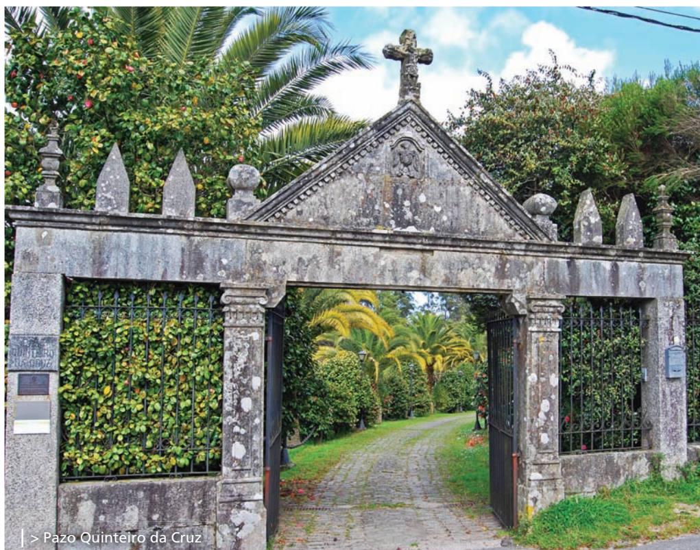
| > Pazo Quinteiro da Cruz