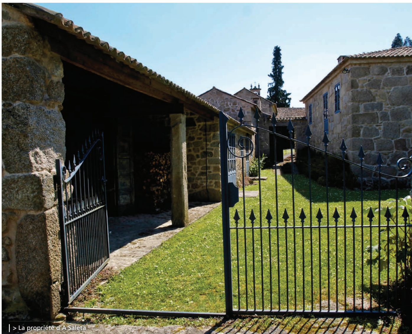
| > La propriété d'A Saleta