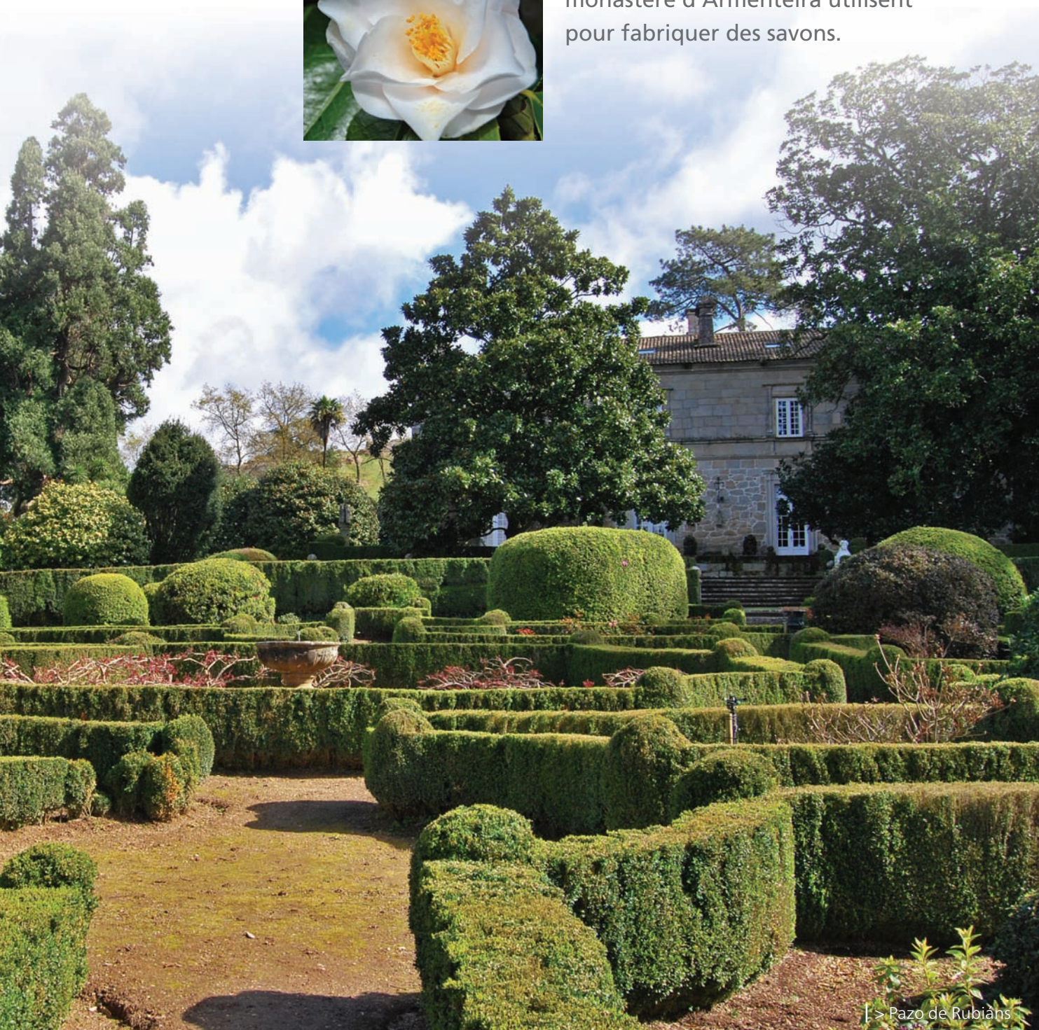
| > Pazo de Rubiáns

Les graines de ces camélias servent à extraire des huiles que les sœurs du monastère d'Armenteira utilisent pour fabriquer des savons.