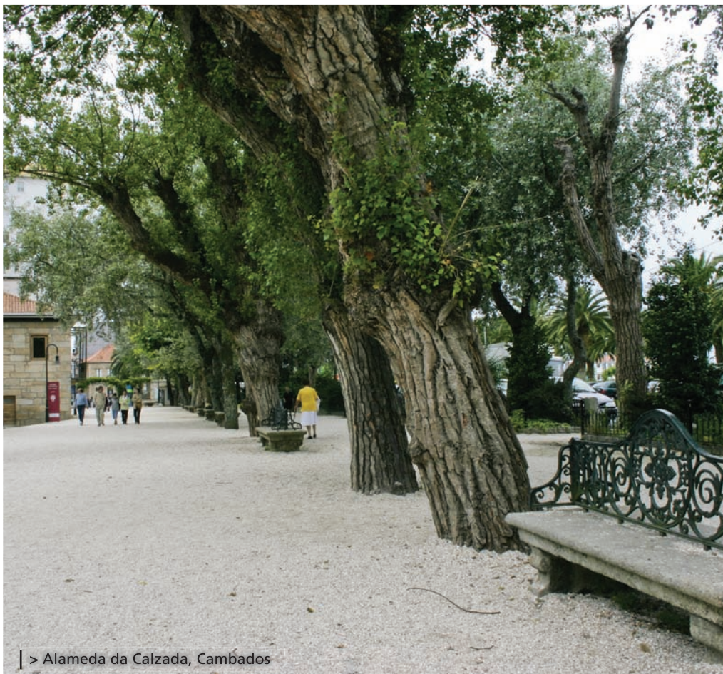
| > Alameda da Calzada, Cambados

Nous vous proposons de commencer l'après-midi dans le Musée ethnographique et du vin, l'un des premiers sur le thème du vin créé en Espagne. À partir de l'Alameda da Calzada, il faut parcourir un tronçon de l'Avenida de Vilariño jusqu'au carrefour avec la rue de San Francisco, que nous suivrons jusqu'au croisement avec l'Avenida da Pastora, que nous remonterons jusqu'au musée. Ce dernier est installé dans un ancien presbytère du XVI e siècle, dite Casa de Ricoy , et nous l'identifierons par une grande enseigne sur la façade. À l'intérieur, nous découvrirons les secrets du vin d'O Salnés et de l'Appellation d'origine Rías Baixas.