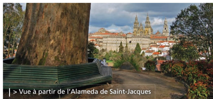
> Vue à partir de l'Alameda de Saint-Jacques

L'allée centrale de l'Alameda était autrefois réservée à la haute société et les allées latérales aux classes les plus modestes.