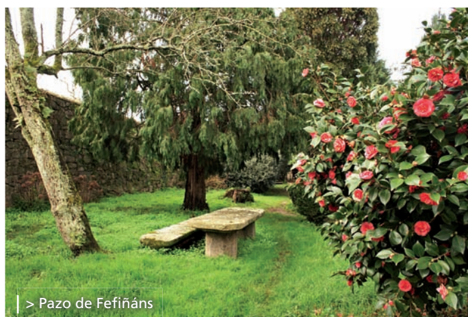
> Pazo de Fefiñáns