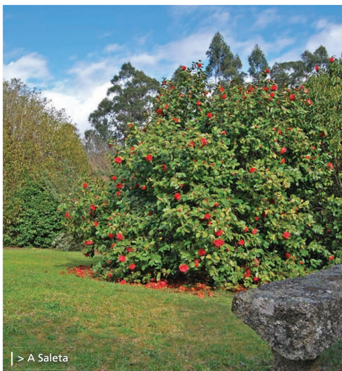
| > A Saleta