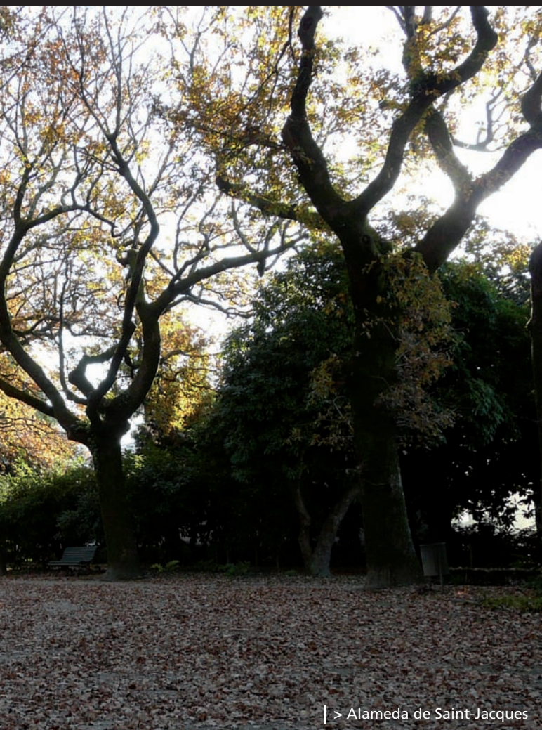
| > Alameda de Saint-Jacques

Ses parterres, bancs, statues, sculptures, fontaines, étangs, kiosque à musique, pigeonnier et églises aident à recréer des ambiances dix-neuvième, modernistes et actuelles. Sans en oublier la valeur comme jardin botanique, grâce à sa grande variété d'espèces végétales dont beaucoup sont exotiques.