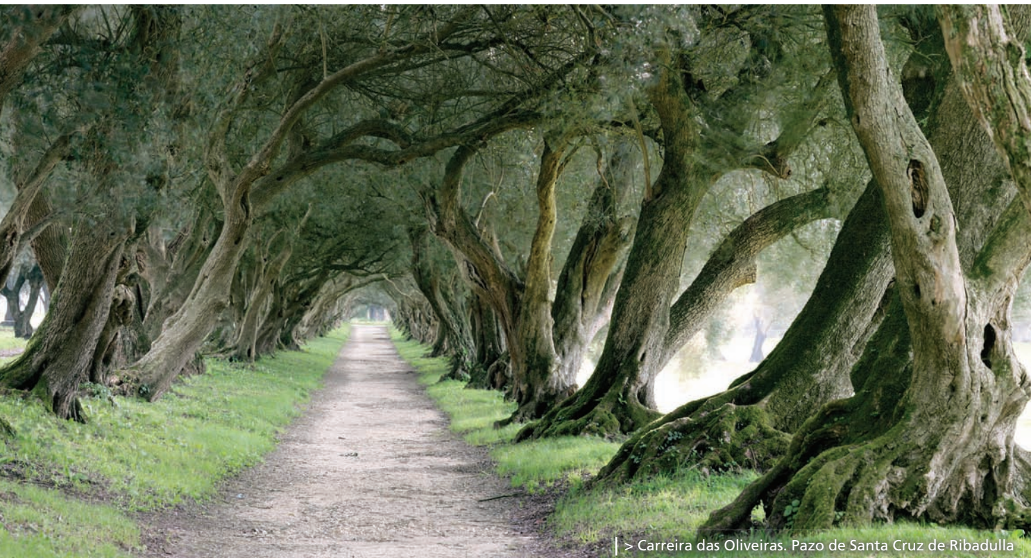
| > Carreira das Oliveiras. Pazo de Santa Cruz de Ribadulla