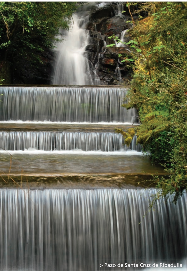
> Pazo de Santa Cruz de Ribadulla