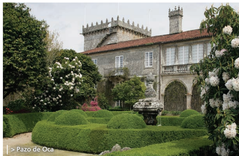
> Pazo de Oca