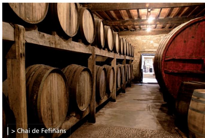
> Chai de Fefiñáns

L'intérieur du Pazo de Fefiñáns accueille depuis 1904 le chai le plus ancien de la ville. Bodegas del Palacio de Fefiñanes produit trois types d'albariño et des eaux de vie. Si vous programmez à l'avance, vous pourrez parcourir les différentes salles de fermentation, élevage et mise en bouteille. Et voir ainsi le processus de production sur place, accompagné du personnel du chai, qui vous expliquera pas à pas l'élaboration des crus, que vous pourrez ensuite déguster. Dans des installations aussi anciennes vous verrez cohabiter les technologies de production les plus modernes et l'élevage du vin en fûts de chêne, conservés dans une ambiance dominée par la pierre et le bois.