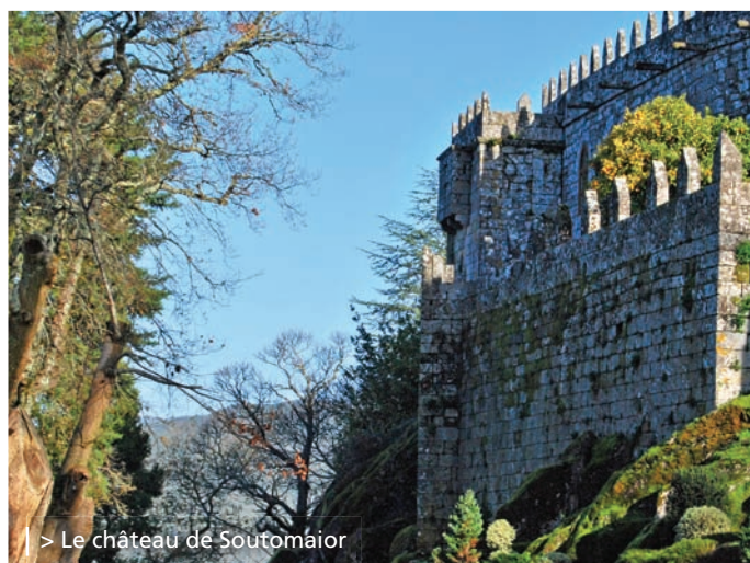
> Le château de Soutomaïor