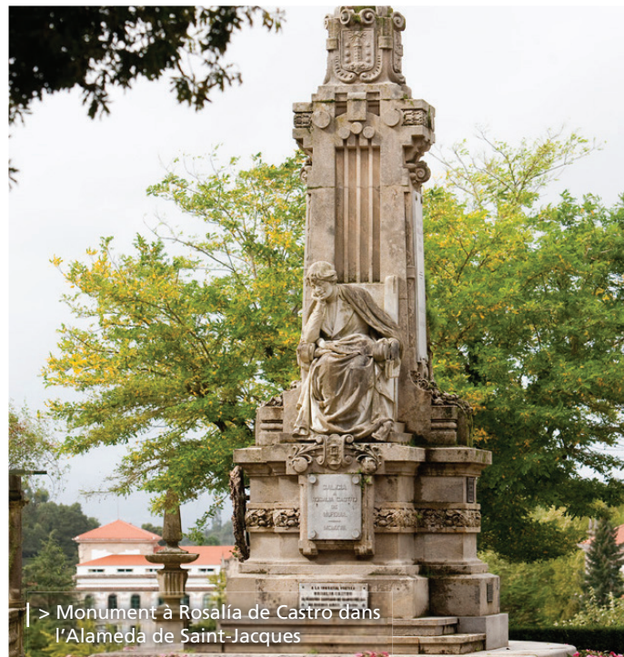
> Monument à Rosalía de Castro dans l'Alameda de Saint-Jacques