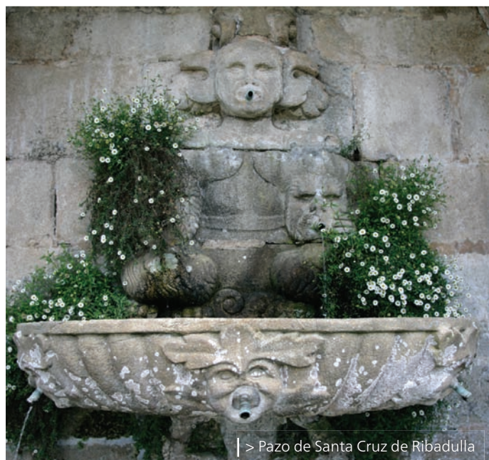
| > Pazo de Santa Cruz de Ribadulla