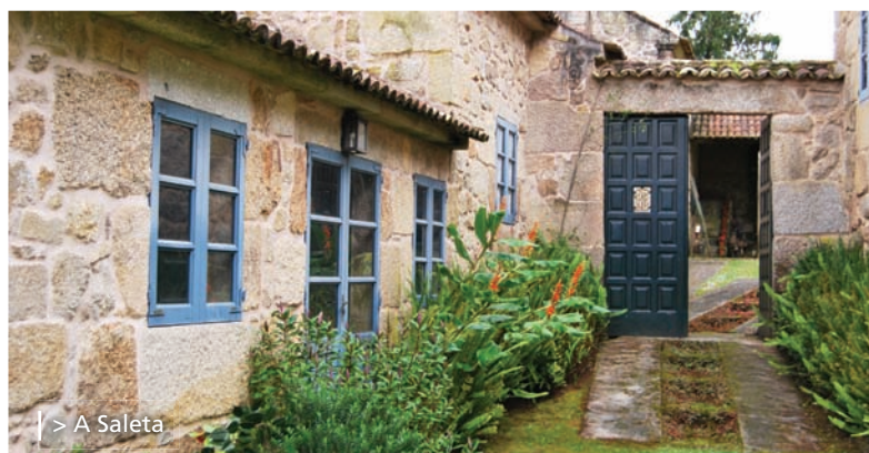
| > A Saleta