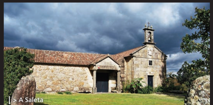
| > A Saleta