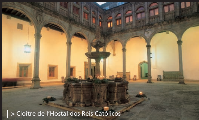
| > Cloître de l'Hostal dos Reis Católicos

“Chove en Santiago meu doce amor. Camelia branca do ar brila entrebecida ô sol.”