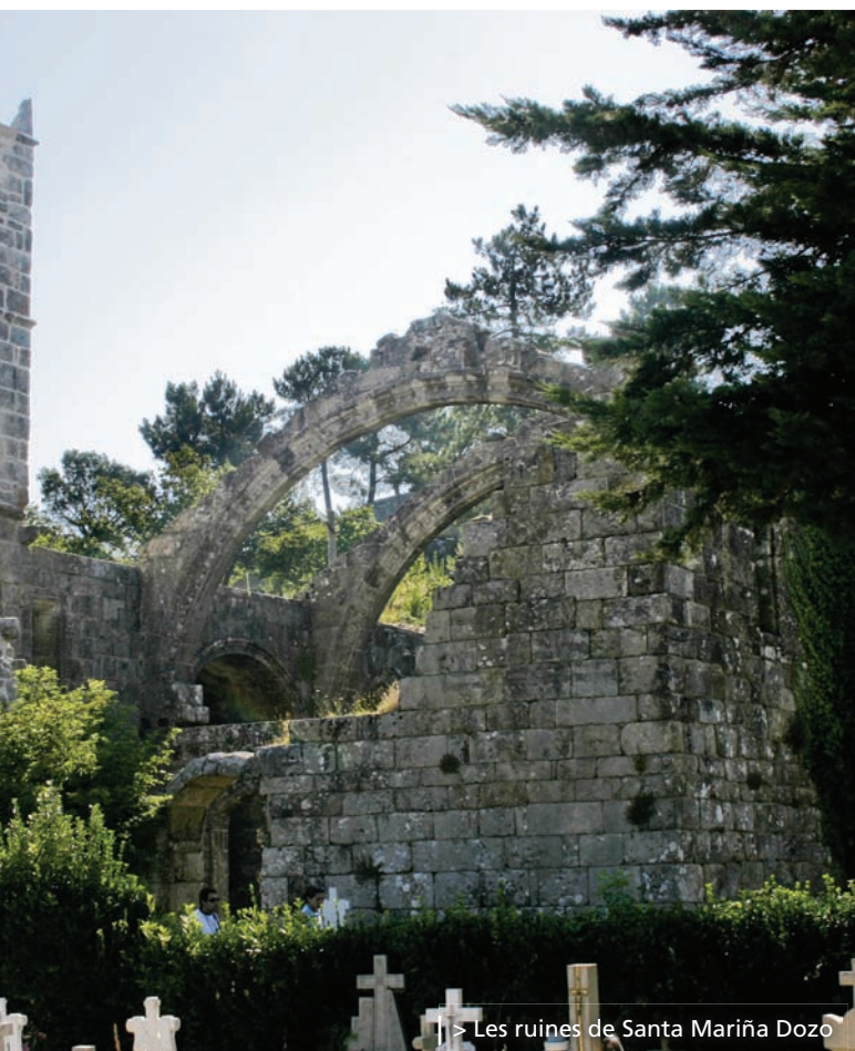
> Les ruines de Santa Mariña Dozo

Les hypothèses sur la destruction partielle de l'église au XIXe siècle parlent d'un incendie, fortuit ou provoqué, causé par les affrontements ou les révoltes continues de l'époque. La sensation de mélancolie et de romantisme que peut inspirer cet endroit se multiplie lorsque le ciel est nuageux ou, s'il fait beau, au moment où le soleil se couche sur l'Atlantique à partir du Monte da Pastora . À ce moment-là, la lumière joue à cache-cache entre les arcs. C'est l'instant précis pour prendre de belles photos.