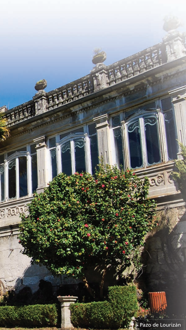
> Pazo de Lourizán

On accède à l'ensemble fortifié par un pont levis. Sur la porte on distingue les armoiries des marquis de Mos. Dans le palais, vous pourrez visiter les pièces entièrement restaurées et la «Galería de Damas» (Galerie aux Dames), merveilleusement taillée et constituant un magnifique mirador sur la cour d'honneur.