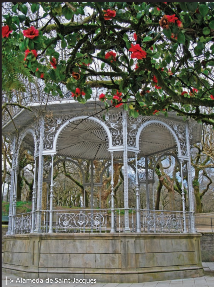
| > Alameda de Saint-Jacques