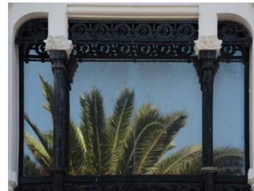
ABAJO Kiosko Alfonso

Por el camino pasaremos por la praza de Santa Catalina, adonde acudían las aguderas de A Coruña con sus «sellas», para llenarlas con el agua de la FUENTE DE NEPTUNO . Es la fuente más antigua de la ciudad y está presidida por el Dios del Mar, que en su escudo porta la Torre de Hércules. En las inmediaciones se hospedaban las conocidas como «catalinas», mujeres del rural que en