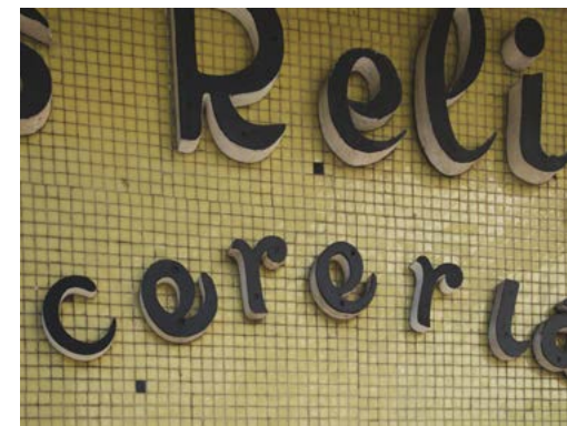
PÁGINA OPUESTA Mercado de San Agustín ARRIBA Iglesia de San Nicolás ABAJO Rótulo de la Cerería y Objetos Religiosos

En este entorno recientemente se han instalado algunos negocios singulares como Vintage & Coffee (praza San Agustín nº 2), donde se puede encontrar moda, complementos u objetos de decoración genuinos de los años 70, 80 o 90. Tesouros (rúa Pío XII nº 1), donde se muestra el trabajo de 12 artesanos de la