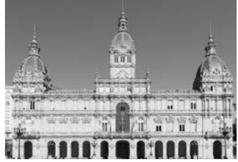
A Praza de María Pita y Ayuntamiento de A Coruña