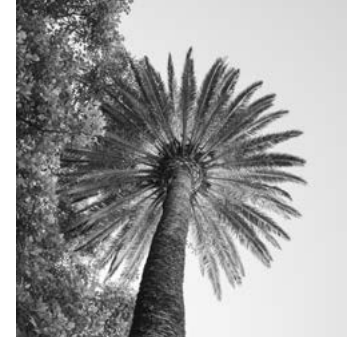
F Jardines de Méndez Núñez