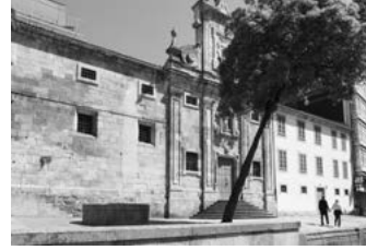
C Iglesia de las Capuchinas y Museo de Bellas Artes