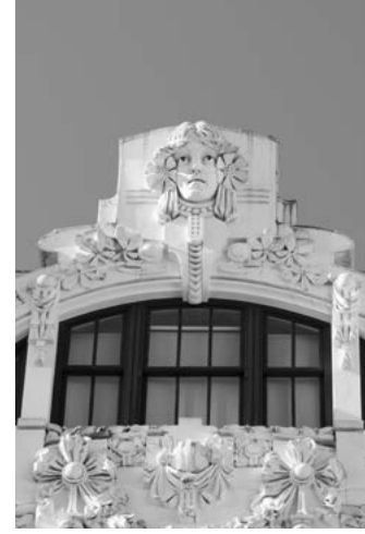
E Praza de Lugo — mercado de abastos