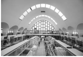
B Mercado de San Agustín