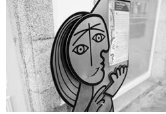
D Casa museo Picasso